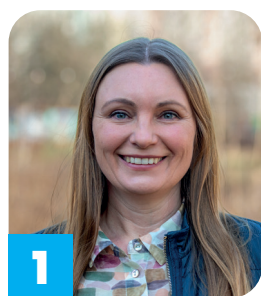
1 Iwona Walentynowicz